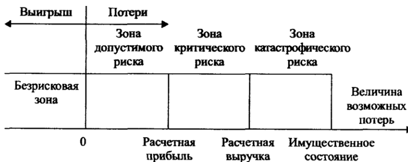
Рис. 9.1. Схема зон риска

Риск — случайная категория и поэтому наиболее обоснованно с научных позиций характеризовать его как вероятность возникновения определенного уровня потерь. При всесторонней оценке риска следовало бы устанавливать для каждого абсолютного или относительного значения величины возможных потерь соответствующую вероятность возникновения такой величины. Построение кривой вероятностей (или таблицы) — исходная стадия оценки риска. Применительно к предпринимательству эта задача чрезвычайно сложна. Поэтому приходится ограничиваться упрощенными подходами, оценивать риск по одному или нескольким показателям, представляющим обобщенные характеристики, наиболее важные для суждения о приемлемости риска. Рассмотрим некоторые из главных показателей риска. С этой целью сначала выделим определенные области или зоны риска в зависимости от величины потерь, возникающих в процессе реализации проекта