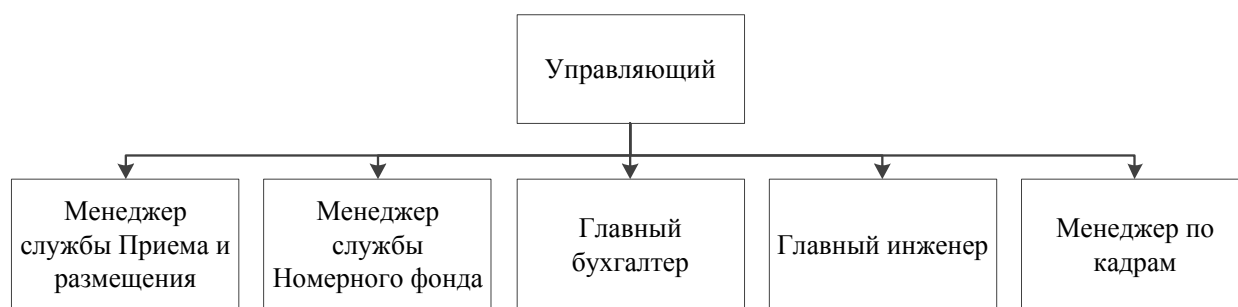
Рисунок 1.3 – Организационная структура ООО «Гостиница», 2020 г.