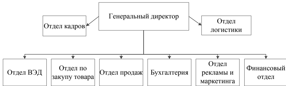
Рисунок 1.3 – Организационная структура ООО «Востокшинторг» в 2015 г.