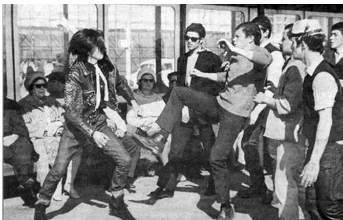
Рис. 3. Моды и рокеры. Противостояние

Работа А. Коена «Народные бесы и моральные паники» основана именно на этом подходе. Объектом исследования Коена стали две английские молодежные субкультуры 1960-х гг. – «моды» и «рокеры» (рис. 3). Его исследование показало, каким образом из нескольких столкновений между этими группировками, в основном в курортных местах на юге Англии, вырос целый социокультурный феномен огромного масштаба. Немалую роль в этом сыграли средства массовой информации, которые делали своеобразную рекламу этим группировкам своими сверхподробными статьями о действиях их членов и реакциях работников органов социального контроля, полиции и судов [26].