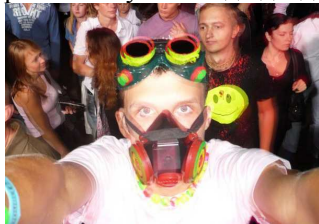
Рис. 19. Рэйвер на дальневосточном фестивале «P.L.U.R.»

ную общность обычной молодежи, слушавшей и танцевавшей под электронную музыку и не входившей в продвинутую клубную сцену. Культура рейва – это всеобщие бдения, культ экстази, пацифизм и унисекс (рис. 19). Постепенно рейв коммерциализировался, поэтому частью альтернативной молодежи стал расцениваться как разновидность техно-попсы. В коммерческих рейв-проектах может принимать участие до двадцати тысяч человек.