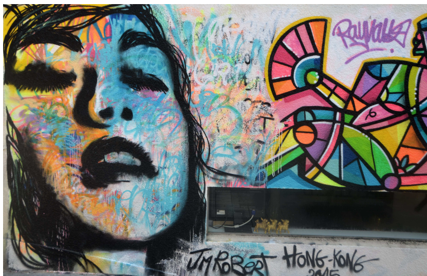
Рис. 9. Фрагмент граффити в Гонконге

4. Хип-хоп, брейк-данс и граффити. «Уличная культура», получившая широкое распространение с середины 1970-х годов в США, а затем во многих странах мира как одна из субкультурных форм освоения молодежью социальной субъектности через создание, освоение, распространение, развитие четырех основных направлений: брейк-данс, хип-хоп, граффити и ди-джеинг (рис. 9). В составе элементов хип-хоп культуры рассматриваются также стритбол (уличный футбол), роллинг (определенная техника катания на роликах) и др.