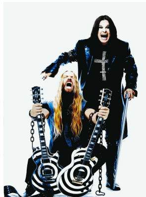
Рис. 14. Классические металлисты

Движение металла можно разделить на две группы: более спокойное и радикальное. К радикальному движению относятся особо агрессивные группы и металлисты-сатанисты. К металлистам примыкают те группы подростков, которым нравятся костюм неформала и рок-музыка. Более опытные группы их серьезно не воспринимают, бывалые, старые металлисты, возраст которых старше 35–40 лет, составляют более спокойное течение.