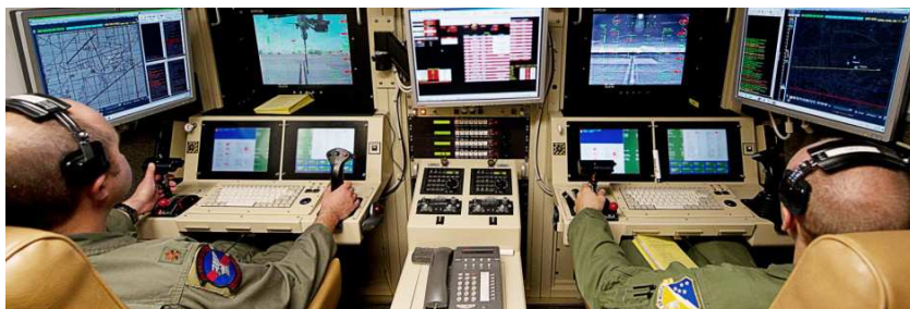
Рис. 21. Геймеры на военной службе (управление беспилотниками)

Геймеры – люди, увлекающиеся компьютерными играми наряду с прочими общечеловеческими развлечениями не в ущерб возложенным на них социальным функциям. Геймерами также называют людей, испытывающих нездоровую патологическую тягу к компьютерным играм, повлекшую за собой некоторое смещение восприятия реальности, но не переходящую в ранг психической ненормальности (рис. 21).