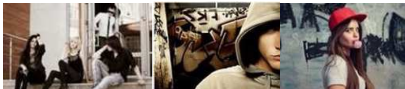
Рис. 2. Представители различных иерархий молодежных субкультур

Айзенштадт писал, что молодые люди по-своему стремятся к обретению чувства стабильности, чтобы как-то компенсировать социальный опыт изменений, к чувству собственного достоинства, чтобы в какой-то степени компенсировать социальный опыт безвластия. При помощи своих действий молодежная культура помогает молодому человеку почувствовать себя хорошо (комфортно, стабильно), как бы ни оценивали его действия окружающие. Панки, например, могут выглядеть забавно, смешно на фотографиях, но совсем другой смысл это имеет для молодого человека, который стал панком. Для него (нее) это значит достигнуть определенной меры успеха и статуса внутри данной субкультуры. Для функционалистов в принципе существует определенная иерархия между молодежными группами или важность «равных групп» (рис. 2).