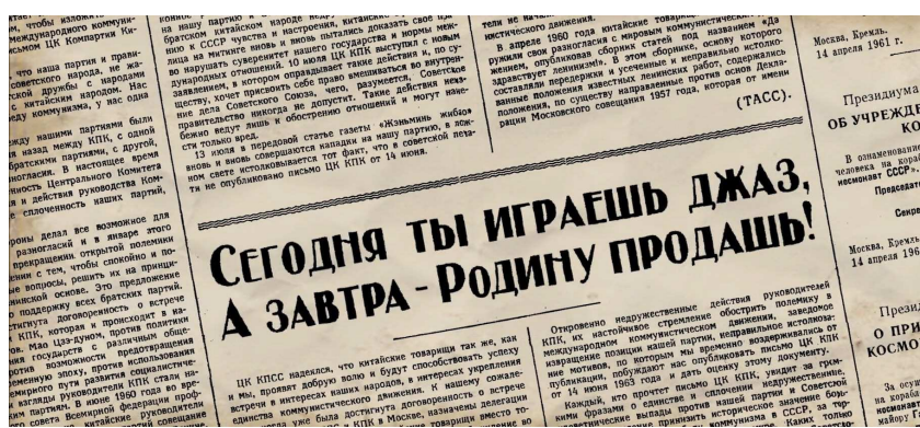
Рис. 12. Статья, «разоблачающая» стилиг

С конца 1946 г. им проводилась антиджазовая кампания, в ходе которой были арестованы тысячи музыкантов, а джаз был назван «инструментом американского империализма». Эта линия сверху сопровождалась растущим интересом к западной музыке и стилю среди культурной интеллигенции и урбанистической молодежи, которая поколенчески окрепла еще до начала «культурной оттепели» Н. Хрущева. Советская молодежь больше не рассматривалась как жертва буржуазных норм, которые достались от прошлой жизни, а как жертва современного западного влияния. Именно этим объясняется нападение на джаз и западные танцы как источник массового развращения молодежи. В этой практике они следовали высказыванию М. Горького, который приравнял джаз к «гомосексуальности, наркотикам и буржуазному эротизму». Комсомол начал активную кампанию избавления от дьявольского влияния общественных танцевальных площадок. Наиболее ярким примером можно назвать отношение к так называемым «стилягам» (рис. 12).