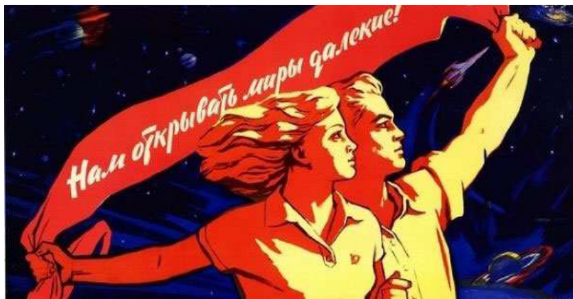
Рис. 11. Комсомольские плакаты (советский период)

продвижения по службе, участие в общественной деятельности (рис. 11). Чем более тяжелой была борьба за новую жизнь, тем больше молодежь тянулась к комсомолу. Миллионы молодых людей добровольно уехали на грандиозные стройки сталинских времен, веря в то, что они действительно построят новое социалистическое общество.