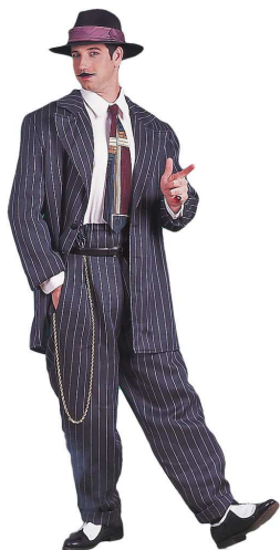
Рис. 6. Субкультура «зут»

И впервые на уличных углах, у кофейных лавок появляются группы «зут» – одна из первых городских молодежных субкультур (рис. 6).