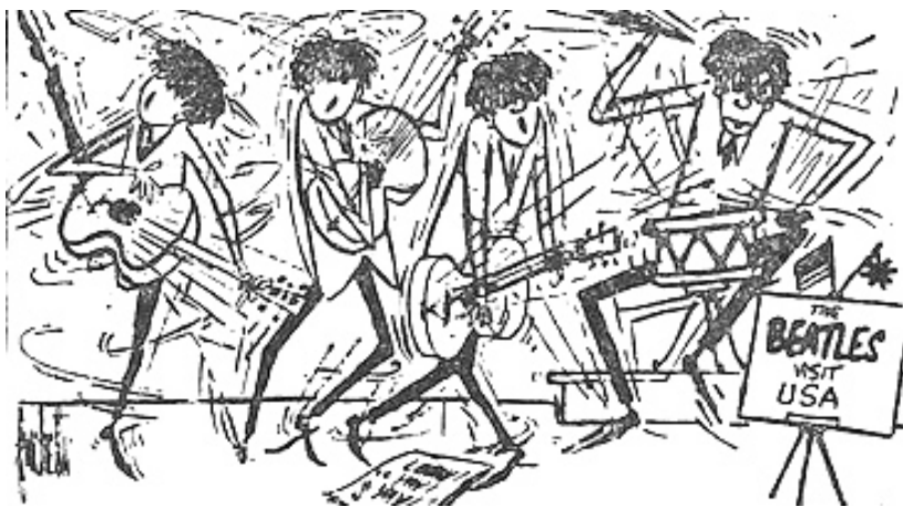
Рис. 13. Карикатура из газеты «Комсомольская правда» в 1980-е гг.

Но самым интересным в обсуждении проблемы молодежного досуга было практически полное отсутствие голоса или мнения самой молодежи. Кроме этого, якобы открытое обсуждение проблемы (в стиле «гласности») происходило без попыток как-то выйти за пределы понятия молодежи как объекта дурного западного влияния. Образ жизни западной молодежи понимался не только как культурно чуждый, но и политически вредный. Западную рок-музыку подвергали особо жесткой критике. Одни авторы видели в ней общую попытку Запада разрушить советскую власть способом постепенного «оглушения» молодежи через музыку (рис. 13).