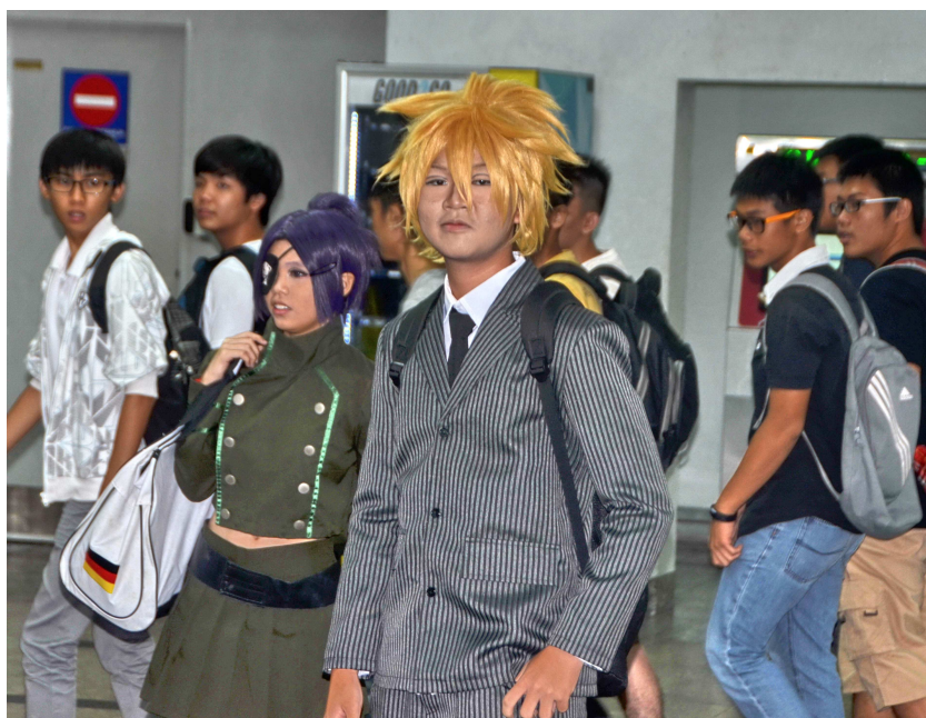
Рис. 22. Феномен глобализации – субкультура косплей в Малайзии

Глобализация этой субкультуры связана с тем, что миллионы людей по всему миру играют в одни и те же популярные игры, а наиболее успешные участвуют в международных виртуальных и реальных турнирах по компьютерным играм. Россия – единственное в мире государство, где компьютерные игры официально признаны спортом, официально действует Федерация компьютерного спорта, а ее участники получают спортивные разряды [20] (рис. 22).