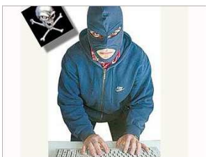
Рис. 20. Хакерская деятельность

Хакеры. Истоки субкультуры хакеров берут начало в 1960-е гг. в Массачусетском технологическом институте США, где молодые ученые, раздраженные бюрократическими препонами на пути к малодоступным в то время компьютерам, начали прокладывать собственный путь в информационные системы (рис. 20).