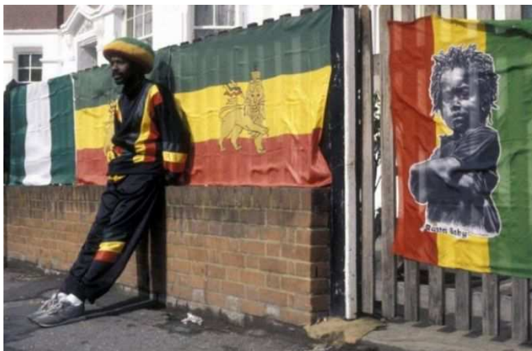
Рис. 5. Растафари

Особое подозрение общество испытывало по отношению к такой черной молодежной субкультуре, как «rastafari» («растафари»), которая сформировалась на основе одного музыкального стиля и политических взглядов молодых черных (рис. 5). Но уже к концу 1970-х гг. стало очевидно, что вся молодежная культура на Западе развивается на основе взаимодействия африканских, азиатских и новоевропейских культурных влияний. Работы П. Гилрой показали, как происходил этот положительный культурный обмен.