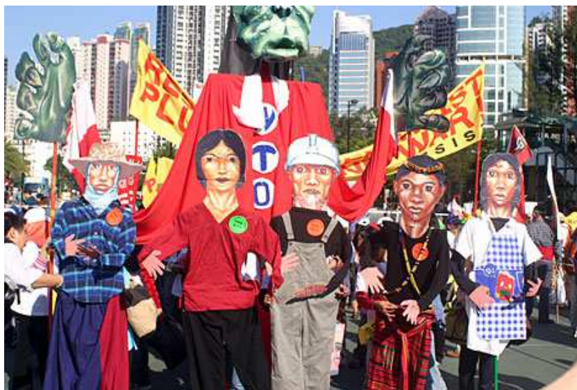
Рис. 23. Демонстрация антиглобалистов

Антиглобалисты. Как ни странно, антиглобалистов также можно считать субкультурой, попавшей под влияние глобализации. С начала 2000-х гг. по всему миру начинают формироваться антиглобалистские движения и организации. Начало было положено во время массовой акции в Сиэтле в декабре 1999 г., которая была связана с прохождением конференции ВТО и направлена против политики экономической глобализации, вызвала большой резонанс в мировом сообществе, спровоцировав демонстрации протеста во Франции, Германии, Канаде и других странах (рис. 23).