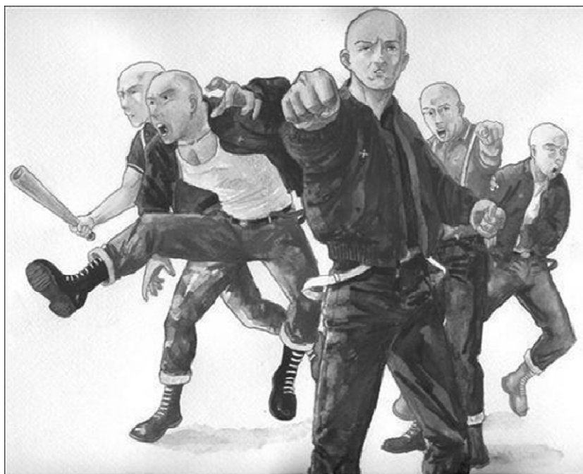
Рис. 8. Скинхеды (плакат)

мажоров. В 1969 г. в Лондоне произошла драка между морскими пехотинцами и скинхедами (рис. 8).