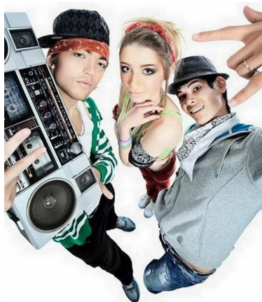
Рис. 1. Тинейджеры

Именно с этих позиций изучали в 1950-е гг. американские функционалисты культуру тинэйджеров. Понятие «тинэйджер» употребляется социологами не в буквальном быденном смысле. В принципе, тинэйджер – это подросток с 13 до 19 лет (пока в номинации возраста присутствует корень teen). Для социологов же это понятие имеет, прежде всего, отношение к подростковой потребительской культуре, то есть буквально это «подросток потребляющий» (рис. 1).