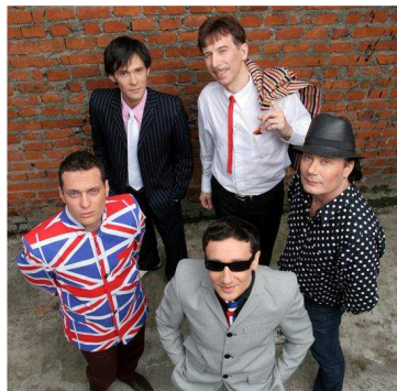
Рис. 15. Новые стилиаги, гр. «Браво»

В 1980-х годах у панков стала модной причёска «ирокез». Они наносили черепа и знаки на одежду и аксессуары. Носили напульсники и ошейники из кожи с шипами, заклёпками и цепями. Многие панки делали татуировки, а также носили рваные протёртые джинсы, которые сами специально резали (рис. 16).