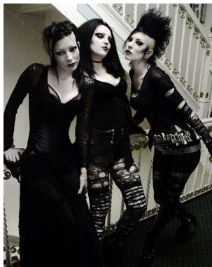
Рис. 17. Готы

чёрными шнурками, чёрный или розовый ремень, клетчатая ко-сынка-арафатка на шее.