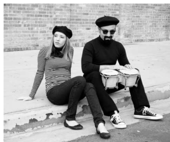
Рис. 7. Битники

Термин «битники» был предложен в 1958 г. журналистом «Сан-Франциско кроникл» Г. Каэном и базировался на сложившихся в американском обществе представлениях о типичном для середины XX в. социальном пласте молодежи, характеризовавшемся асоциальным поведением и неприятием традиционных культурных ценностей нации (рис. 7).