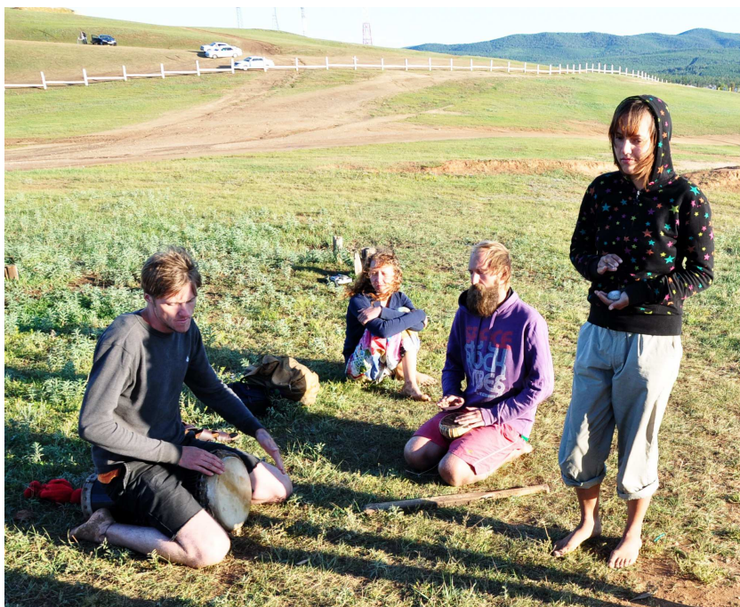
Рис. 18. Русские хиппи на острове Ольхон

Таким образом, молодежная культура в России не началась с перестройки и не является неким чистым подражанием Западу, а, наоборот, имеет свои корни и традиции в России. Тем не менее, расцвет молодежных культур начался в начале 1980-х гг., и уже к концу этого десятилетия появились десятки разных стилей и течений, которые можно было уже называть молодежными культурами, и тысячи молодежных компаний, которые вписывались в подобные течения.