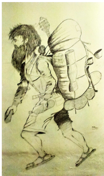
Рис. 10. Изображение бэкпэкера на стене гест-хауса, Куала-Лумпур (Малайзия)

Основатель и идейный вдохновитель класса бэкпэкеров в России – известный путешественник В.А. Шанин, активно продвигавший