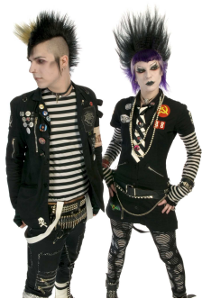
Рис. 16. Панки

«Они (рокабили) более агрессивны, но они – более крутые. В то время было всего лишь несколько стилиаг, кто мог ответить на агрессию, многие были пассивны, и мне это не нравилось» [33].