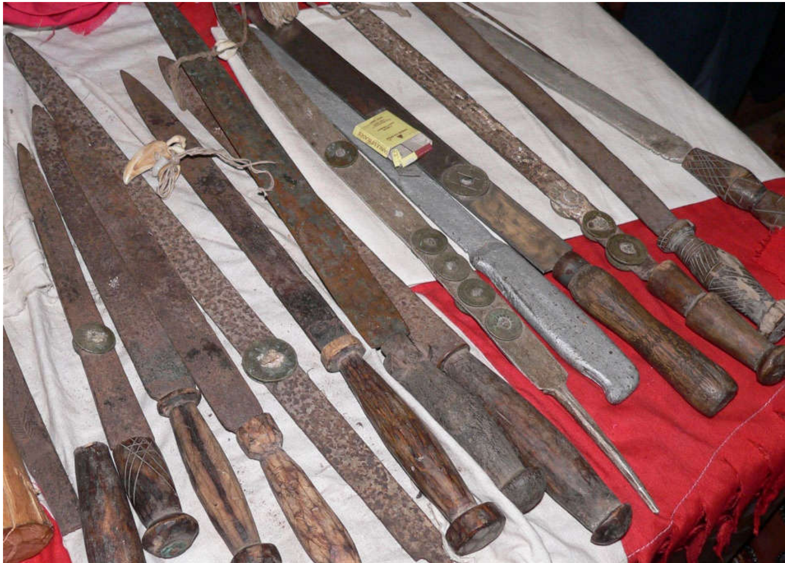
Ceremonial knives used in FGM/C by members of the Bondo society in Sierra Leone

http://www.un.org/apps/news/story.asp?NewsID=43839#.Vgk3PJB01J