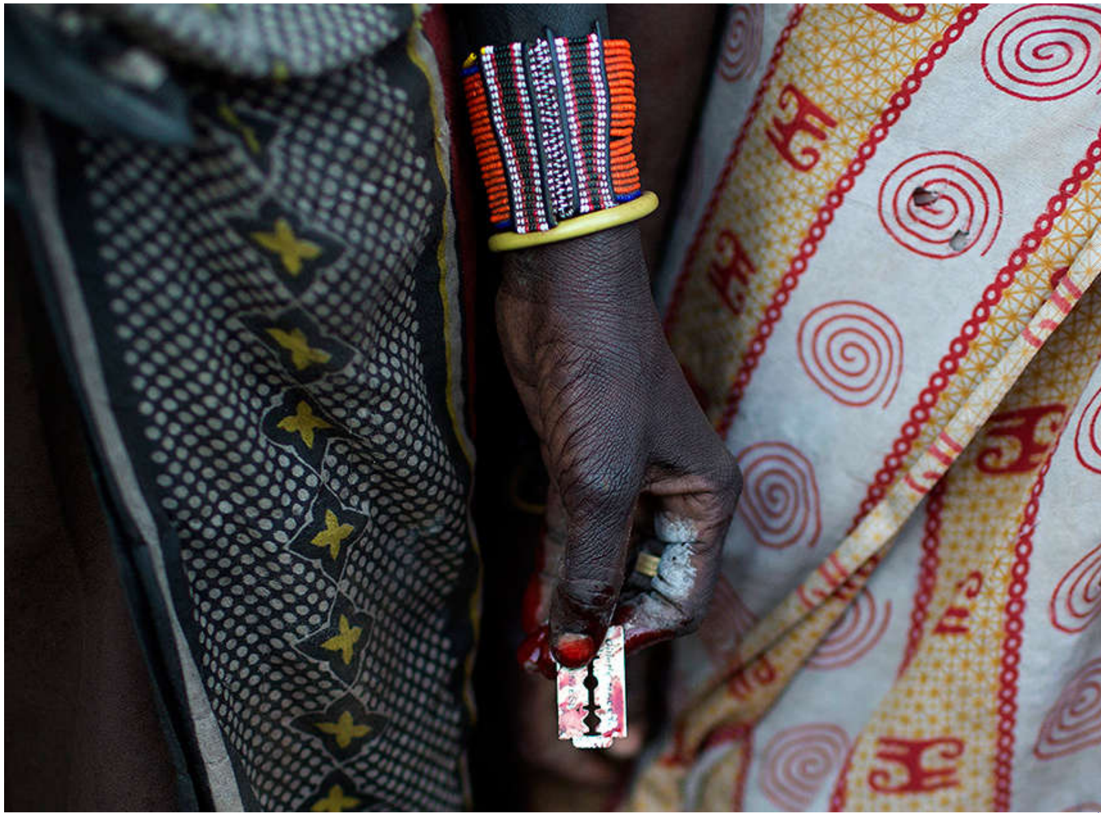
Фото: Siegfried Modola / Reuters http://lenta.ru/news/2015/09/25/fgmnotsocial/