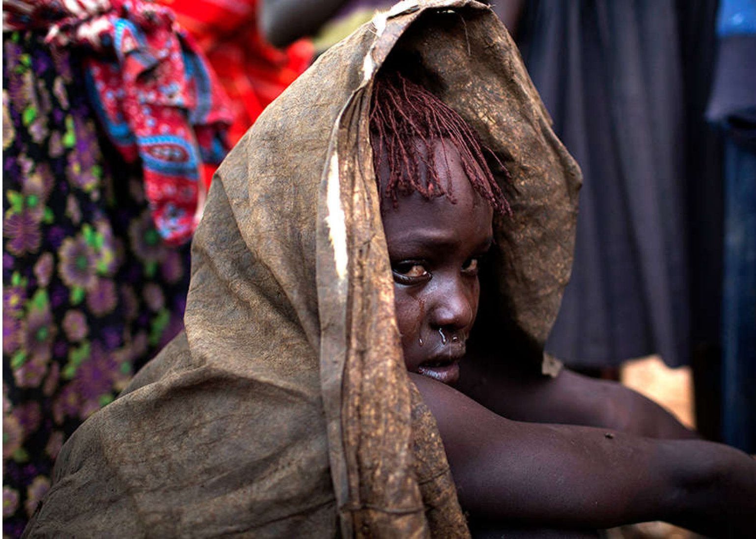
фото: Siegfried Modola / Reuters http://lenta.ru/news/2015/09/25/fgmnotsocial/