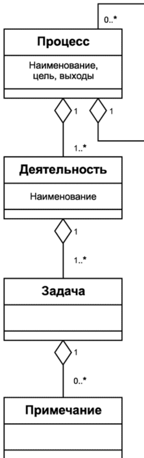
Рисунок С.1 - Конструкции процессов в ИСО/МЭК 12207 и ИСО/МЭК 15288

Примечания используются, если появляется необходимость в поясняющей информации для лучшего описания содержания или структуры процесса. Примечания обеспечивают понимание, относящееся к реализации или области применимости, такой как списки, примеры и другие представления