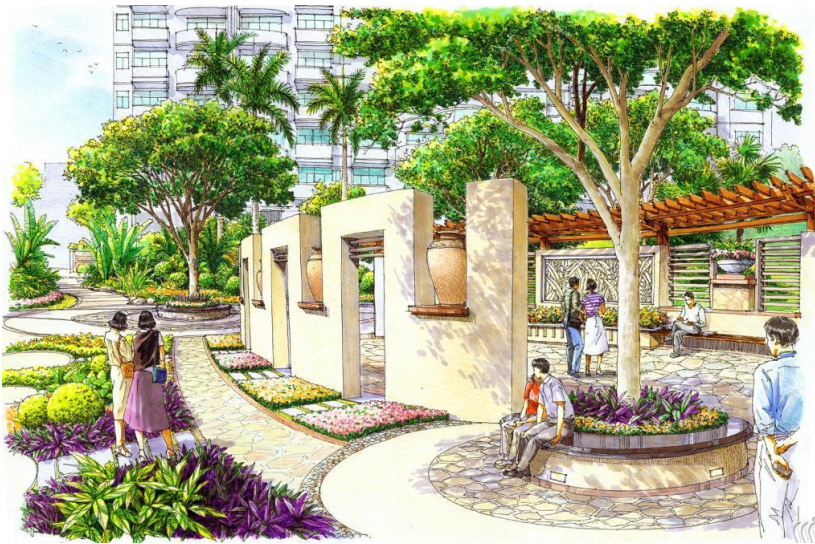
Рис. 5. Видовой кадр прогулочной зоны с выставочным оборудованием в городском сквере