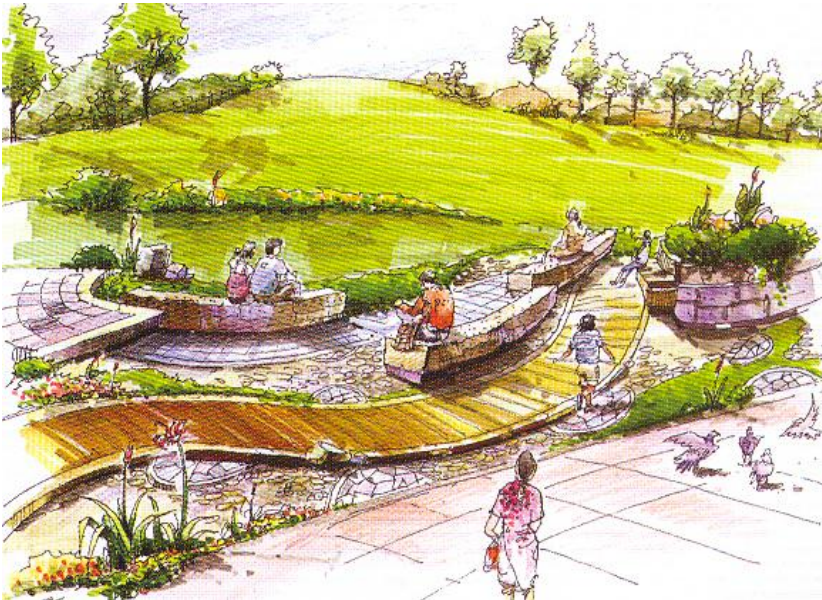
Рис. 2. Видовой кадр прогулочной зоны со скамьями и озеленением в городском парке