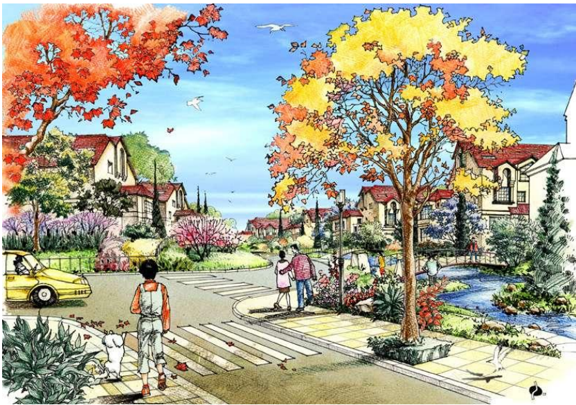
Рис. 4 Видовой кадр зоны перекрестка улиц в пригороде