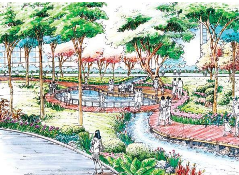
Рис. 8. Видовой кадр рекреационной зоны со скамьями, водными устройствами и озеленением в городском парке