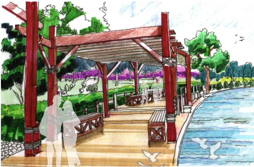
Рис. 7. Видовой кадр прогулочной зоны набережной