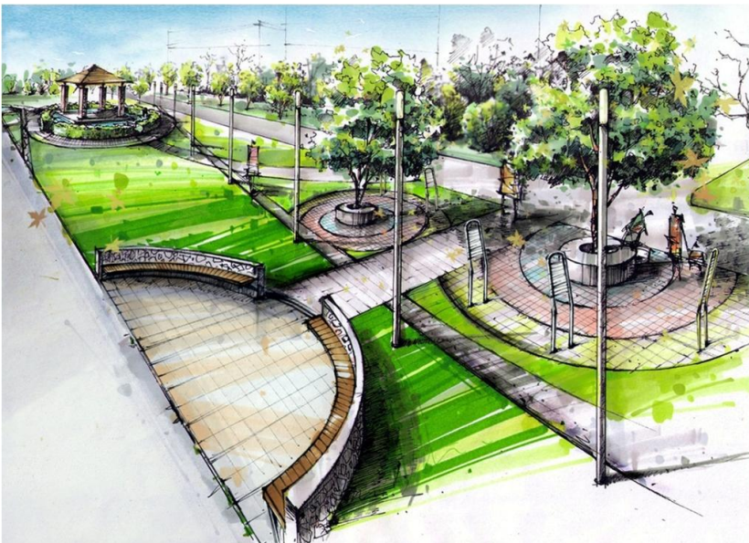
Рис. 6. Видовой кадр городского бульвара