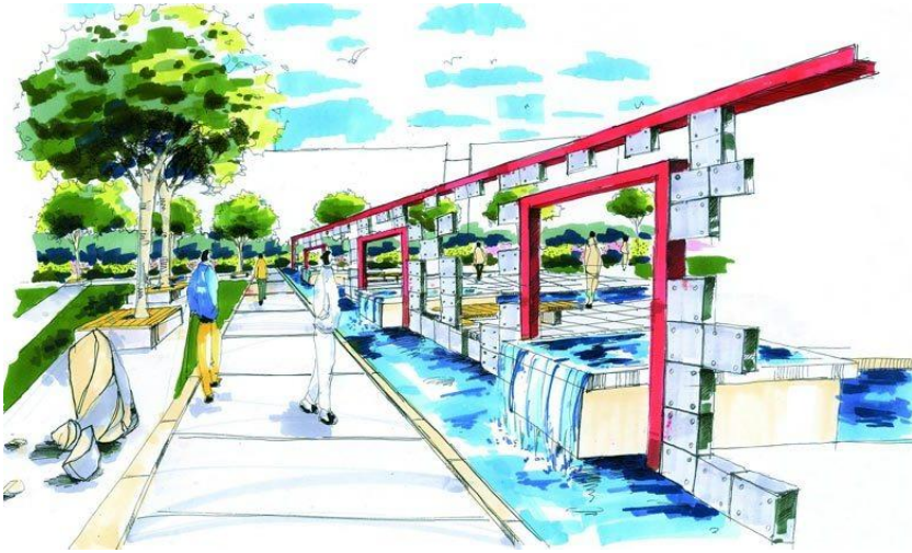
Рис. 3. Видовой кадр прогулочной зоны с водными устройствами в городском парке