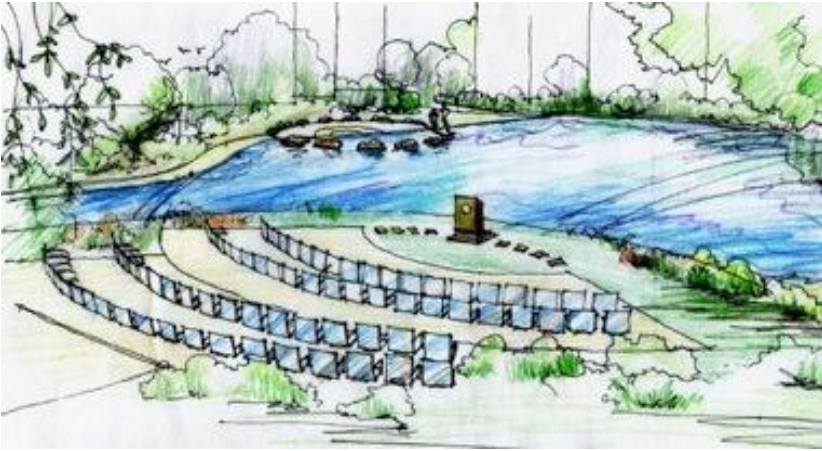
Рис. 1. Видовой кадр образовательной зоны в городском парке